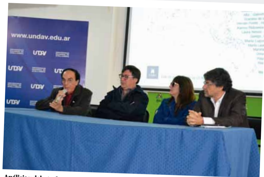
Análisis y debate. Las autoridades en la mesa de apertura de las Primeras Jornadas de Estética y Pensamiento Decolonial llevadas a cabo en la Sede España.