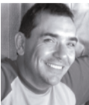
Por Lic. Pablo Reales | Director Académico Turismo

Fueron realizadas por estudiantes de la carrera de Guía Universitario en Turismo y permitieron mostrar la transformación y los cambios espaciales, históricos y sociales de la ciudad.