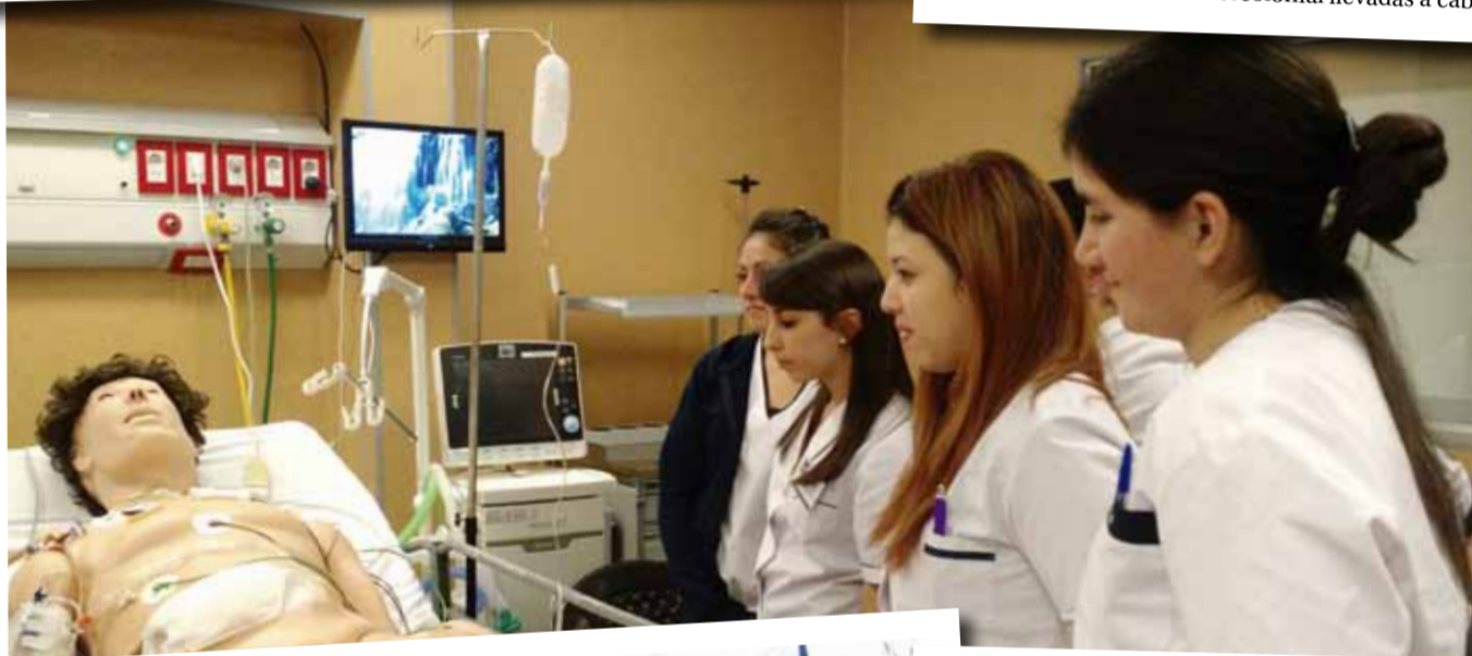
Lo primero es la salud. Estudiantes avanzados de la Licenciatura en Enfermería participaron de un Taller de Cuidados en Situaciones Críticas y realizaron prácticas en gabinetes de simulación con simuladores de alta fidelidad.