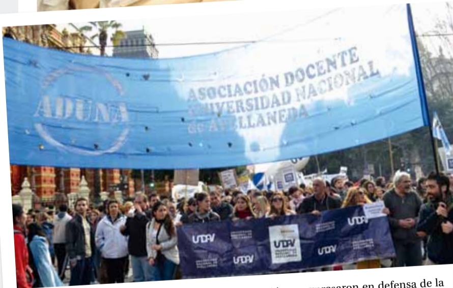
En voz alta. Docentes y no docentes de la Institución se expresaron en defensa de la universidad pública.